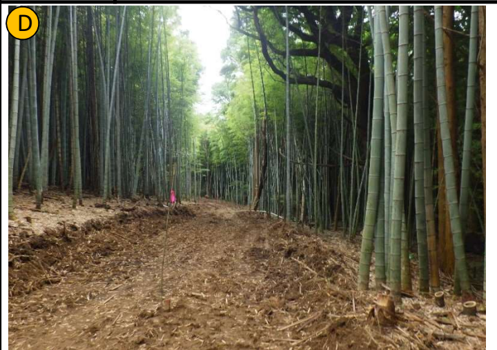
撮影日 | R4.6撮影 | 状況 | 伐根・整地 撮影箇所 | 広場B