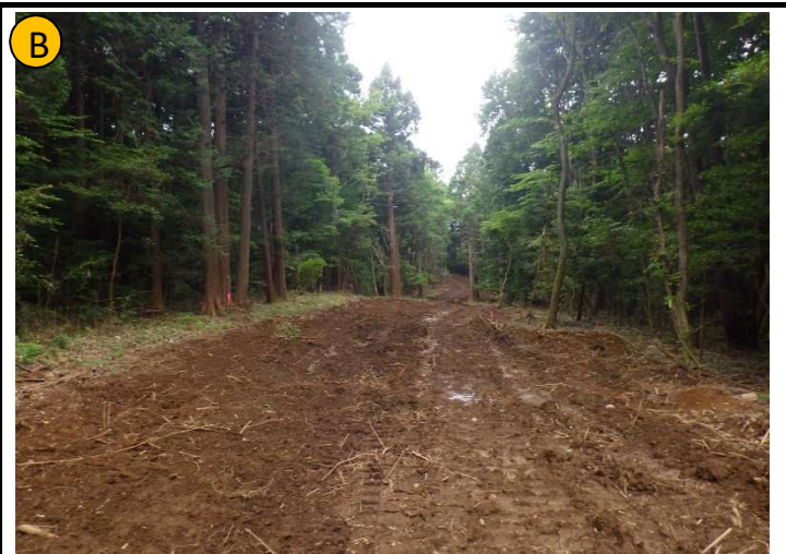
撮影日 | R4.6撮影 | 状況 | 整地・測量 撮影箇所 | 貝殻入りアスファルト舗装