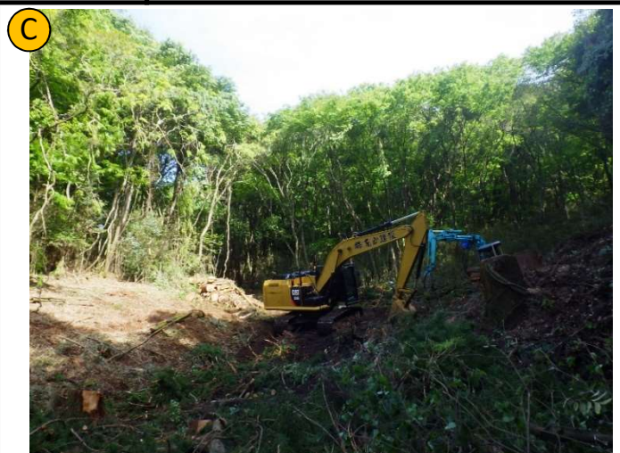
撮影日 R4.5撮影 | 状況 伐採・伐根作業 撮影箇所 廃タイヤ使用ゴムチップ舗装