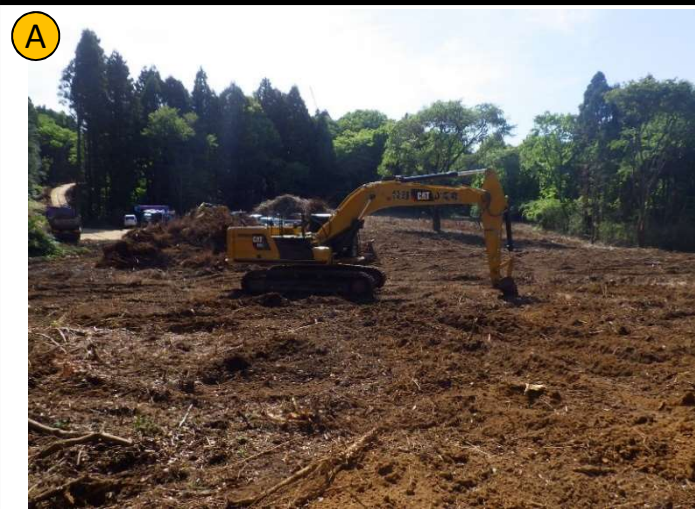
撮影日 R4.5撮影 | 状況 伐根作業 撮影箇所 広場B