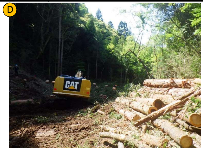
撮影日 R4.5撮影 | 状況 伐採・伐根作業 撮影箇所 廃タイヤ使用ゴムチップ舗装