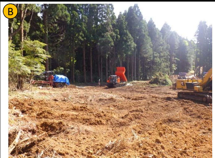
撮影日 R4.5撮影 | 状況 伐根作業 撮影箇所 広場B