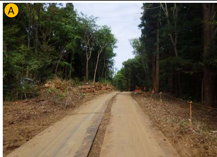
撮影日 R4.4撮影 状況 伐採・伐根作業 撮影箇所 セメント系木質舗装