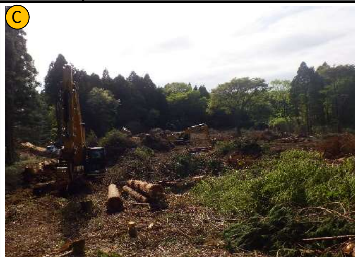
撮影日 R4.4撮影 状況 伐採・伐根作業 撮影箇所 広場B