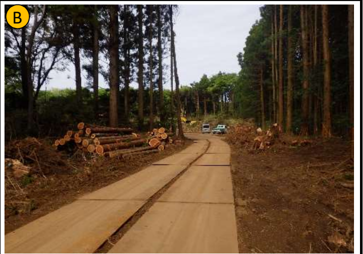
撮影日 R4.4撮影 状況 伐採・伐根作業 撮影箇所 セメント系木質舗装