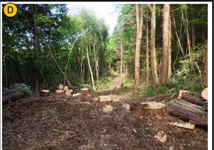
撮影日 R4.4撮影 状況 伐採・伐根作業 撮影箇所 ガラスカレット入りアスファルト舗装