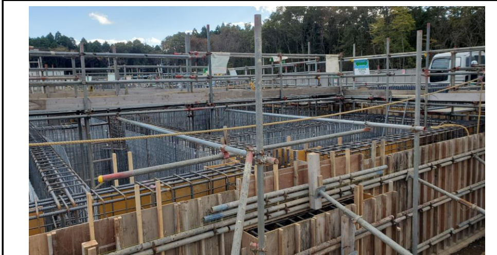
No.23 令和3年10月撮影 工事種別 基礎工事