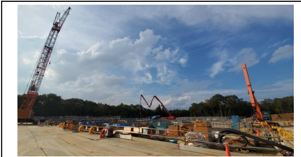
No.21 令和3年10月撮影 工事種別 地業・基礎・土工事